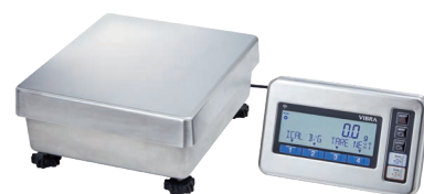
セパレートにした場合(ケーブル長0.8m)

ツインレンジ:FMA33K0.1Tは、10kgを超えると自動的に最小表示が0.1gから1gに切り替わりますが、TAREキーを押す(風袋引きをする)ことで再度10kgまで0.1g表示となります。この機能により重い風袋を載せても、10kgまで0.1g表示の計量が可能となります。