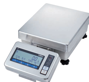
表示部一体型金具(オプション)で取り付けた場合